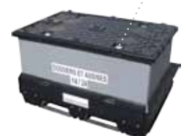
Ceinture plastique alvéolaire ou Tri-Wall