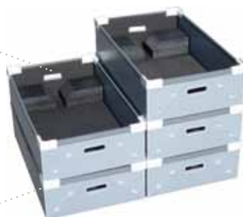
Coins de gerbage