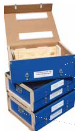
Tri-Wall de couleur