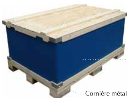
Cornière métallique de renfort