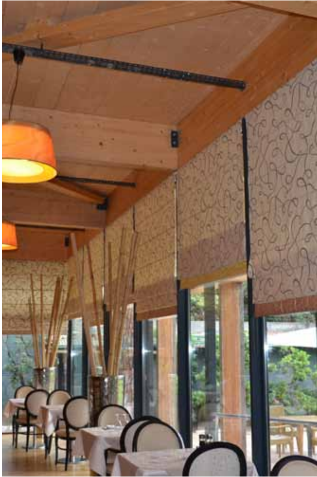
RÉSIDENCES SANTÉ HEALTH RESIDENCE : les Gabres, le Château des Ollières, Résidence la Forêt, la Gentilhommière, le Clair logis, la Chartreuse, l'Agora, les Lierres, Sorgentino, Handivillage, Résidence Eugenia, Arepa Villepinte ...